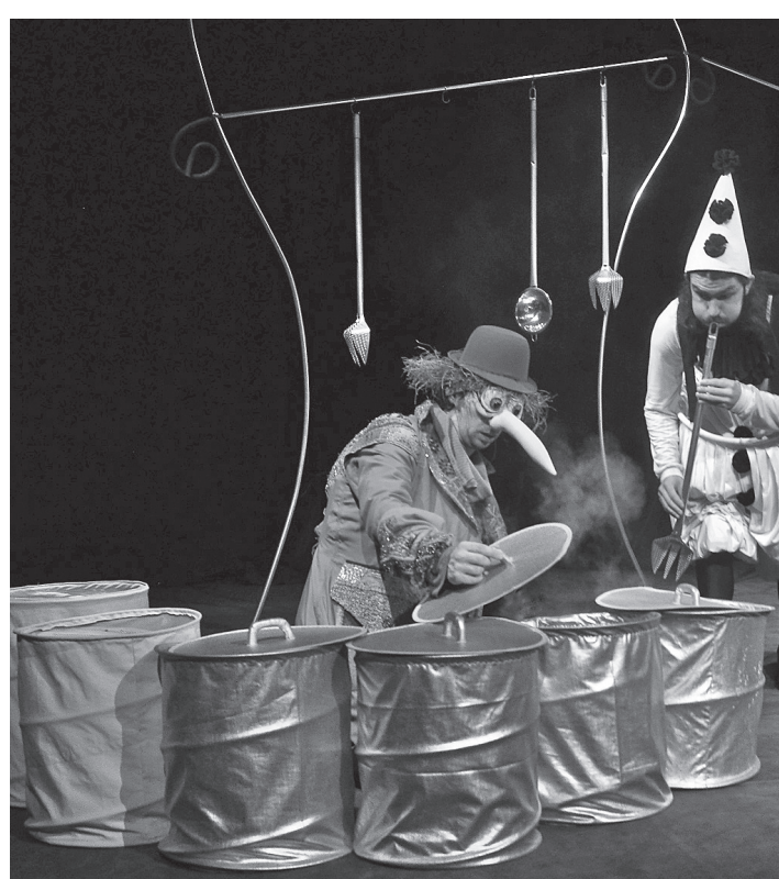
„Джуджето Дълагоноско“ „The Longnose Dwarf“

Обаче оптимистичното фестивално приключение продължи, доказвайки ми, че изгубената/отнетата от теб самия част единствено приятелството може да ти възвърне. Лъвът от „Румето и старият лъв“ на Ямболския куклен театър се чувства откъснат от своя род и корени. Румето му напомня, че с гордост и чест трябва да ги пазим, отстояваме и запознаваме другите хора с тях. Не да бягаме от своята същност и съдба. По този начин Лъвът намира нещо повече от приятелство. Преоткрива, че изтърканиците теми за приятелството, страха, дълга и свободата, желанието и способността да виждаш и да искаш да опознаеш невидимото са оцветени с нова боя. Намира смисъл в това да бъде извън общоприетата черупка с детския си наивизъм, който пробива всички стени и се обединява с другите добри сърца. Без чистотата на Румето, лишена от прегубежението на възрастните и свободно изразяваща мъдростта на детската индивидуалност, нито един от героите нямаше да осъзнае своята истина и да се докосне до себе си. Малко са моментите в живота, които те повеждат в нова посока и преобръщат мисленето, мечтите и чувствата ти. Но те се случват единствено когато подадеш ръка и отвърнеш на подадена ръка. И така можеш да преодолееш всеки страх, да осъществиш невъзможното – като например да се сприятелиш с лъв. Актьорите претворяват сценичното пространство в нещо близко до улица Консервна, то е толкова плътно и близко до теб, поглъщащо и подвижно като самите кукли.