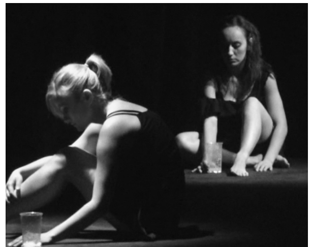
Сцена от "Жажга", ВИА театър, режисьор Велимир Велев "Thirst", VIA Theatre, directed by Velimir Velev