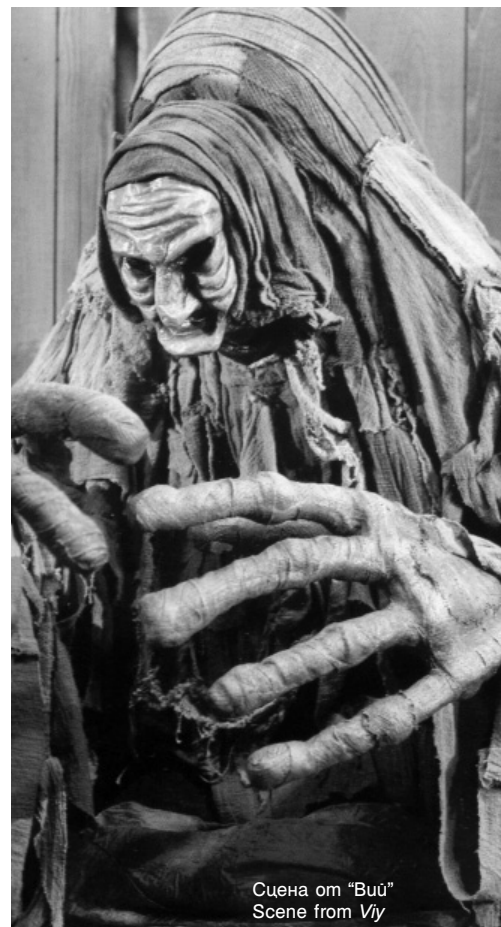
Сцена от “Виѝ” Scene from Viŷ

Специалната награда за цялостен спектакъл “Златният делфин” на спектаклите на Трупа “Абсолвенти”, София, “Джак и бобеното стебло” и “Отвъд