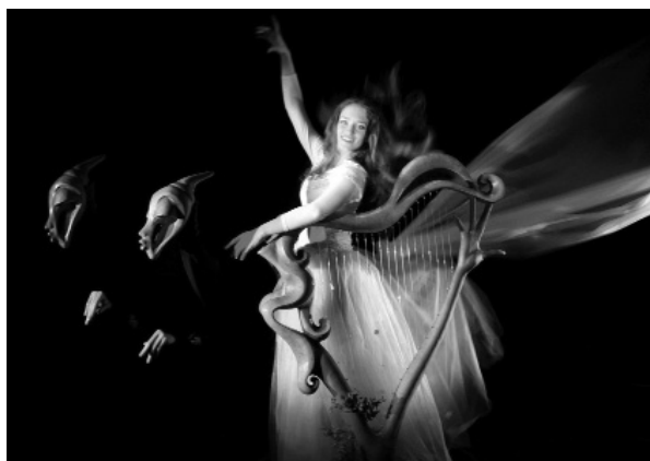
Сцена от "Красавицата и звяра", ДКТ-Варна Scene from Beauty and the Beast, Varna Puppet Theater