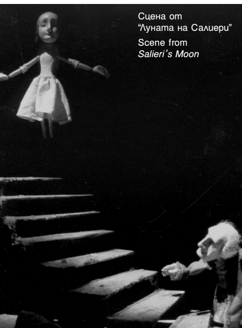
Сцена от "Луната на Салиери" Scene from Salieri's Moon