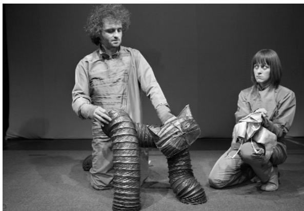
Сцена от “История за чайка и банда котараци” Scene from The Tale of a Seagull and a Band of Tomcats

Великолепният куклено-джазов спектакъл беше замислен от гавна. Адаптацията на популярния роман на чилийския автор “Историята на една чайка и на котарака, който я научи да лети” е съвместна работа на Катя