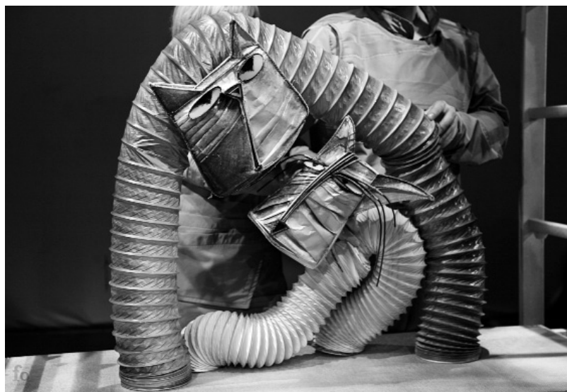
Сцени от “История за чайка и банда котараци” Scenes from The Tale of a Seagull and a Band of Tomcats