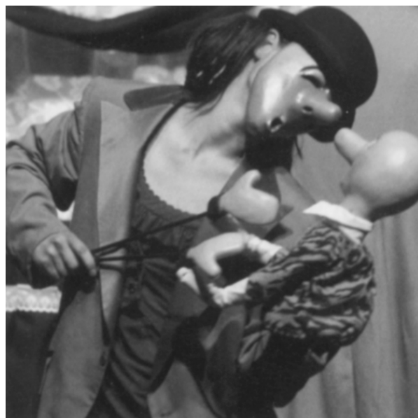
Блуз, блуз Blues, blues

Връчване на наградите и официално закриване на фестивала.