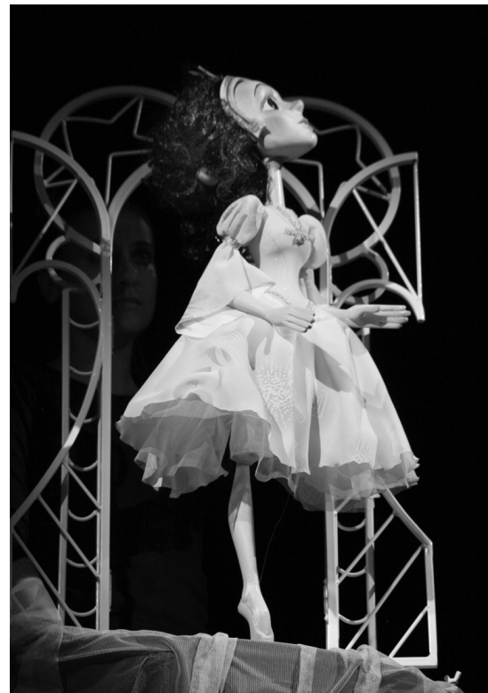
Храбрият оловен войник The Brave Tin Soldier