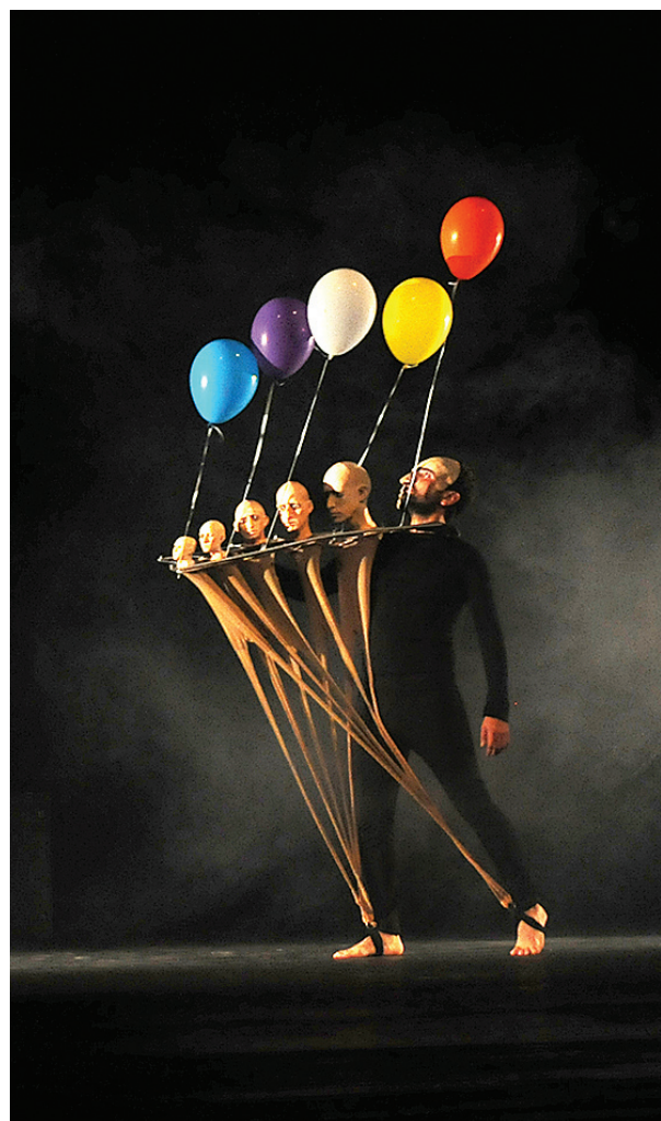
„Аз, Сизиф“

Спектакълът на КТ-Видин (дело на френския режисьор Езекел Гарсия Ромеу) също постави публиката в необичайна ситуация, в която тя е лишена от комфорта на зрителната зала и креслата. Общото при иначе толкова различните представления е фактът, че и трите смесват различни естетически похвати. Физически и визуален театър, site-specific, сензитивни практики, партисипативни техники. И докато за утвърдените театрални и фестивални центрове всичко това отдавна е част от афиша, то в по-малките градове присъстват значително по-рядко, което до голяма степен предопределя и нагласите на публиката. Именно реакциите на зрителите бяха и доказателството за необходимостта от ежегодното провеждане на фестивала. ☞